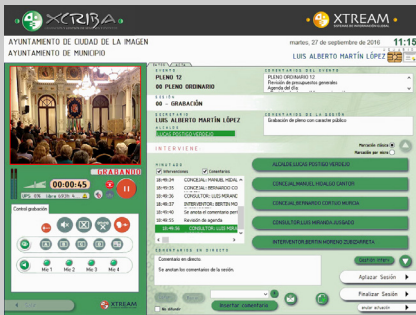
Fig. 2: Interfaz de grabación y catalogación de sesión