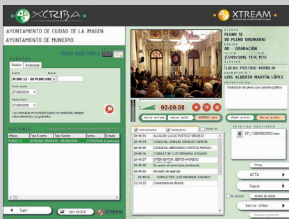
Fig. 3: Interfaz de consulta de grabación de sesión

XCRIBA es la solución de XTREAM que gestiona de forma integral la grabación, catalogación y distribución de sesiones celebradas en Salas de Plenos, Salas de Conferencias y todo tipo de salas de reuniones.